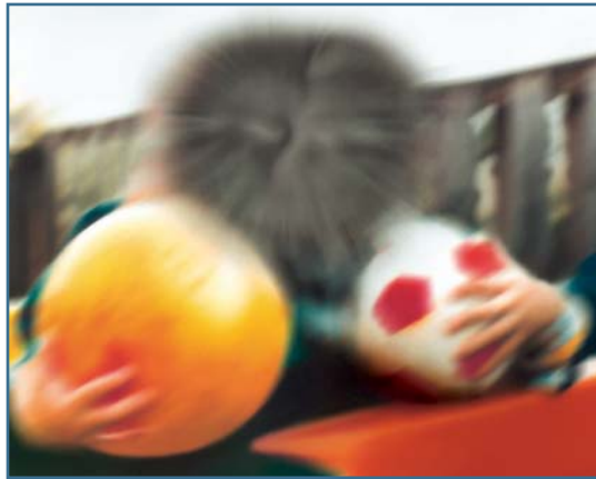
Durch feuchte AMD beeinträchtigte Sicht